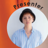
Director / 橋崎 崇太郎 (なんばEKKAN店/フレスポしんかな店)